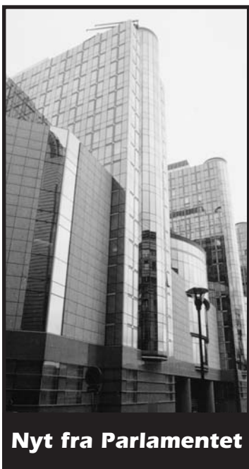
Nyt fra Parlamentet